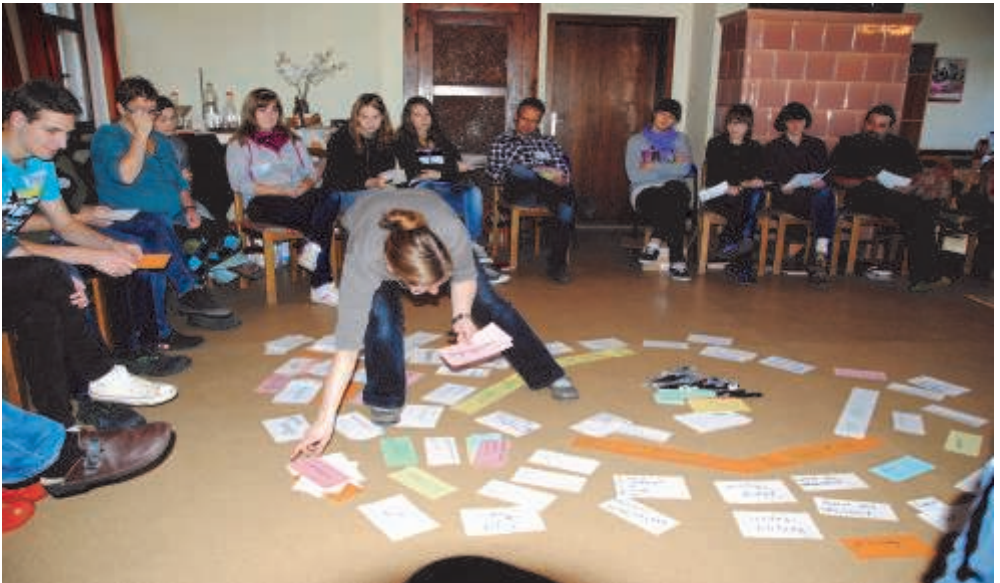
Gemeinderüstzeit in Schmannewitz im Oktober 2011.